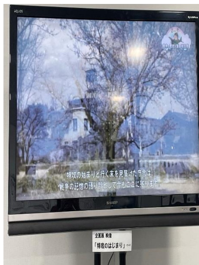
映像「特攻のはじまり」