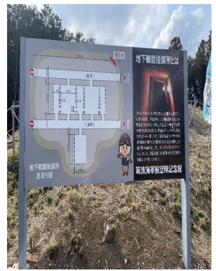
地下戦闘指揮所の見取り図