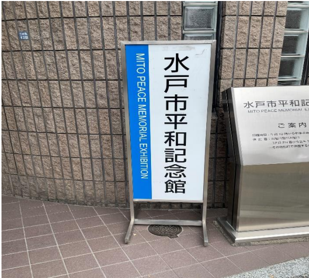
水戸市平和記念館