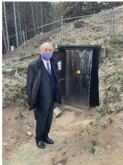
地下戦闘指揮所出入口