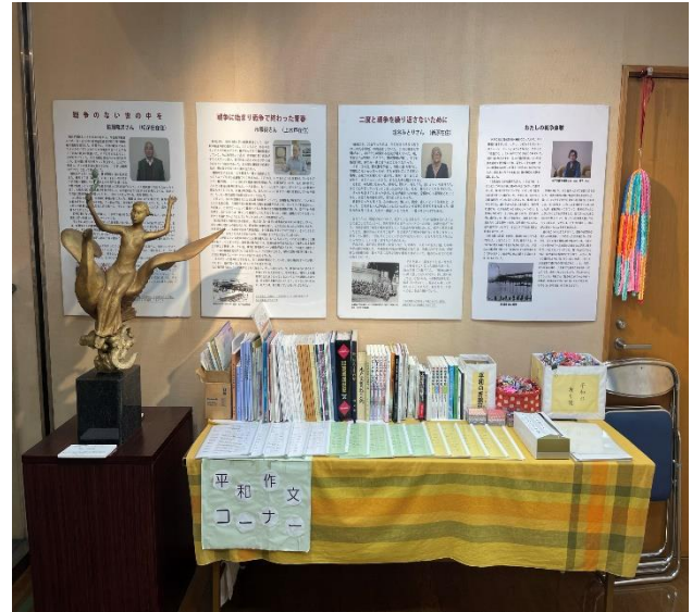
平和作文コーナーおよび戦災体験者の証言