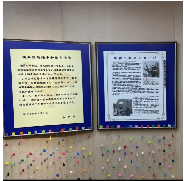
平和都市宣言および平和へのメッセージ