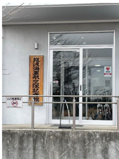
筑波海軍航空隊記念館

地下戦闘指揮所では、地下要塞に入り当時を体感することが出来たり、記念館では、当時を知る方々の映像による貴重な証言を拝聴出来るなど、多くのことを解りやすく学ぶ機会となった。また、来館者に若者が多かったことも印象的であった。