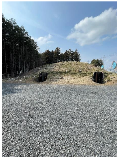
地下戦闘指揮所の外観