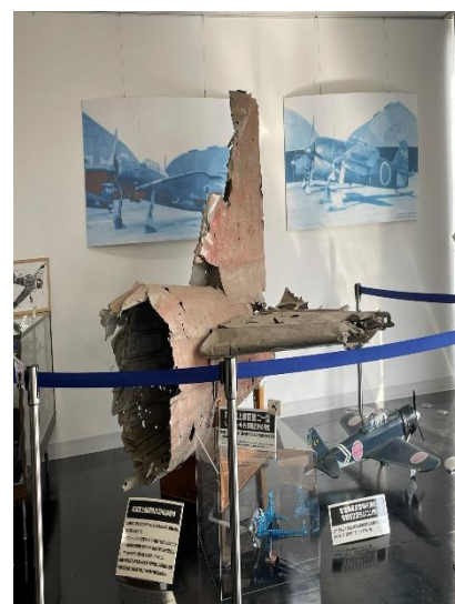
零式艦上戦闘機 21 型後部胴体