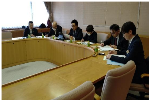
川西市での研修中の様子

川西市のパブリックコメント等見ると、事業の再検証は、市民への行政サービスの低下が危惧されるとの声もある。事業の再検証、つまり行財政改革は、限られた資源を最大限に活用しながら事業を進め財政の健全化と市民サービスの維持向上を目指す取り組みとあるが、釜石市で事業の再検証する場合、小さい自治体であり相手の暮らしが分かり簡単ではないことと思った。再検証は、ゼロか100ではないというところがよりどころか。