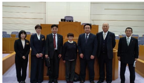
川西市議会議場にて