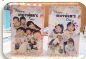
お子さまの可愛い写真で 素敵なフォトインテリアが完成しました!