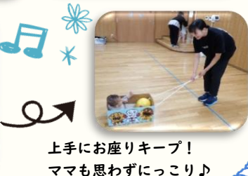
上手にお座りキープ! ママも思わずにっこり♪