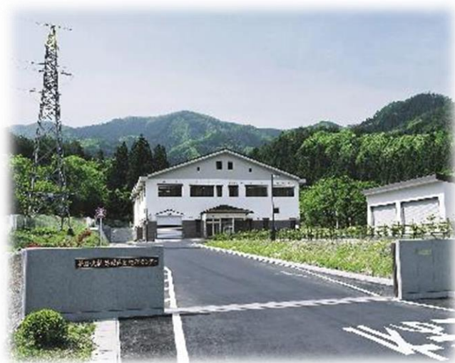
釜石・大槌汚泥再生処理センター