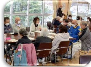
令和7年度 チームオレンジ・こさの 情報交換会

今年度も「チームオレンジこさの」が活動しています。メンバーの皆さんは、スクラム小佐野見守り隊・町内会・100歳体操等の地域活動を通して、認知症のある方・家族の見守りなどで気になる方がいた場合は応援センターほかに相談しています。今年も色々な活動をする予定ですので、このコーナーで紹介していきます。