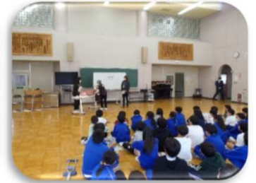
令和7年度 チームオレンジ・こさの ジュニア ステップアップ講座