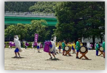
小佐野小学校 小川しし踊り