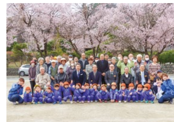
開園式に参加した野田町の住民や子どもたち

東日本大震災後、仮設住宅用地として使用されていた野田中央公園の復旧整備工事が完了し、開園式が行われました。樹木の伐採やグラウンドの整備により、明るく開放的な空間へと生まれ変わりました。早咲きの桜が満開となる中、訪れた子どもたちは元気に遊び、地域の憩いの場としての再出発に、住民から喜びの声が聞かれました。