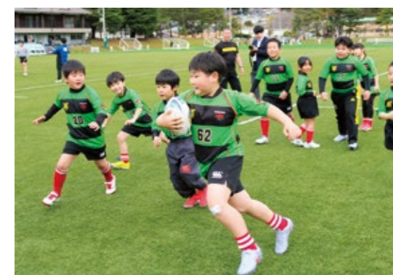
ボールを持ってグラウンドを駆け回る中学年以下の団員

小学生ラグビースクールの釜石シーウェイブスジュニアは、開校式を行い新シーズンをスタートしました。新入団員2人を迎え、団員24人で始動し、それぞれが目標を掲げて練習に励みます。式では指導者らが仲間を思いやる気持ちや挑戦する大切さを呼びかけ、子どもたちは元気に声を上げて意欲を高めました。今季のさらなる成長と活躍が期待されます。