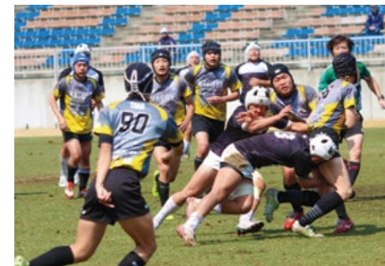
迫力あふれるプレーを見せる選手ら

高校ラグビーの強豪校が釜石市に集う東北復興高校ラグビー交流会が開かれ、全国から16チーム総勢500人を超える選手が参加しました。選手たちは悪天候の中でも泥だらけになりながら熱戦を繰り広げ、互いに刺激し合いました。会場では防災学習や語り部活動も行われ、競技だけでなく命を守る意識についても学ぶ機会となり、交流の輪が広がりました。