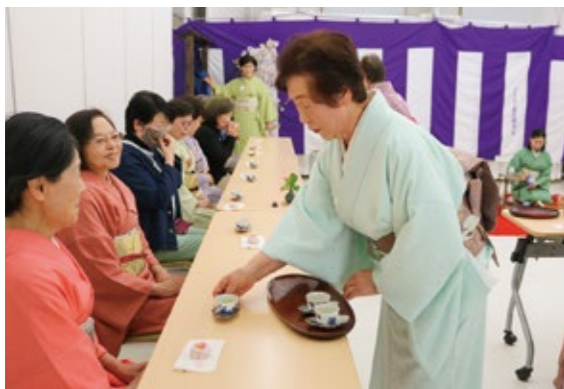
春満開の茶席で釜石蘭煎会の会員がおもてなし