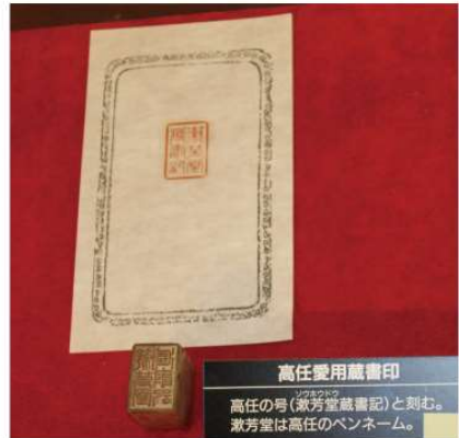
大島の蔵書印 「漱芳堂蔵書記」 漱芳堂は大島の号