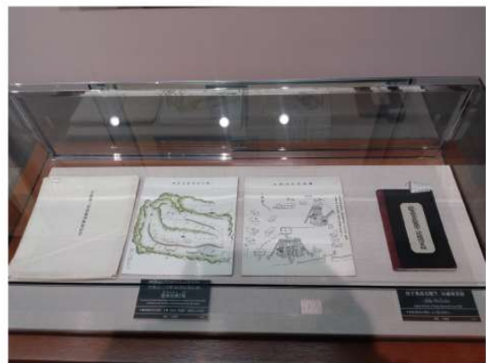
大島二代顕彰碑除幕記念の記念品（左） 故大島高任閣下功績伝承録（右） 大橋の顕彰碑（S17 建立）の記念品と、大島顕彰のために執筆された大島善太郎の記録