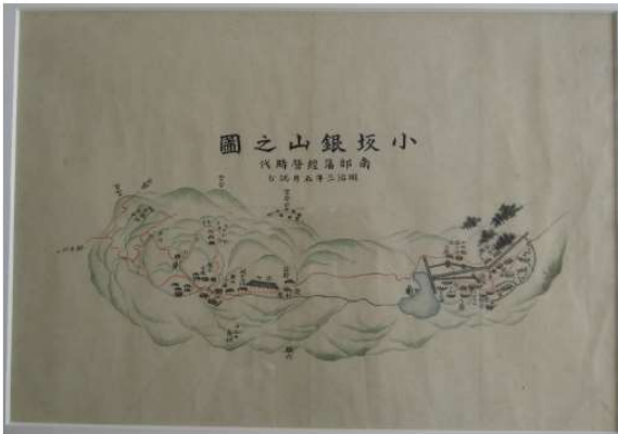
小坂銀山之図 大島が江戸時代（盛岡藩）～明治（官営）にかけて近代化に尽力した。