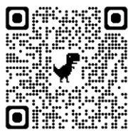
QRコードの読み取り

ご近所の方から聞いてみたり、市のホームページには各地区の活動団体を紹介する「つながる資源リスト」が公開されていますので、下記のQRコードを読み取ってみてください。ホームページを見るのが難しい場合や、「つながる資源リスト」に掲載されていない公民館の行事、趣味活動等の情報については、応援センターまでお問い合わせください。