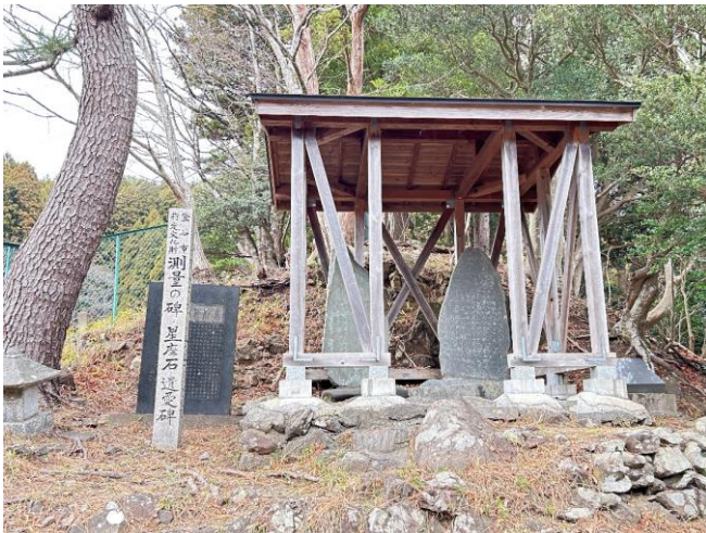
図1. 全景：覆屋の中の右が測量之碑、左が葛西を顕彰した遺愛碑。良く見えないが、手前に星座石が置かれている。 (図3を除き 2025年12月撮影)