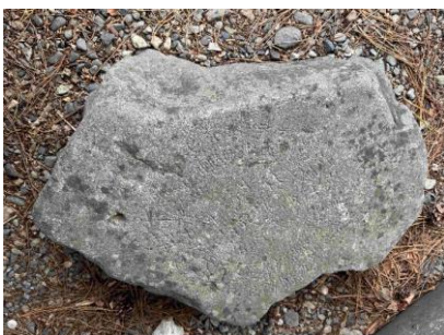
図2. 星座石 (長径70cm、短径44cm、厚さ18cm)