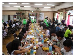
今夏開催時の様子

その他 クリームシチューの食材について、地域の皆さまの温かいご支援をいただくと大変助かります。ご協力よろしくお願いします。