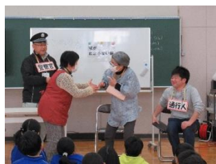
寸劇「家がわからない」 オレンジ大人メンバーも参加

当日は保健師からの認知症についての解説の後、寸劇「家がわからない」を見て接し方を学び、講座終了後はジュニア認定を証するマスコットキャラ「ロバ隊長」デザインの缶バッジを贈りました。その後のアンケート結果からは、多くの児童が関心を持ち、正しい接し方について理解を深めようとする姿勢が伺えて、とても頼もしく感じられました。