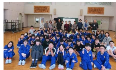
最後はみんなで記念写真