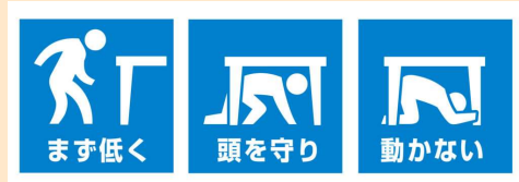
【シェイクアウト訓練】