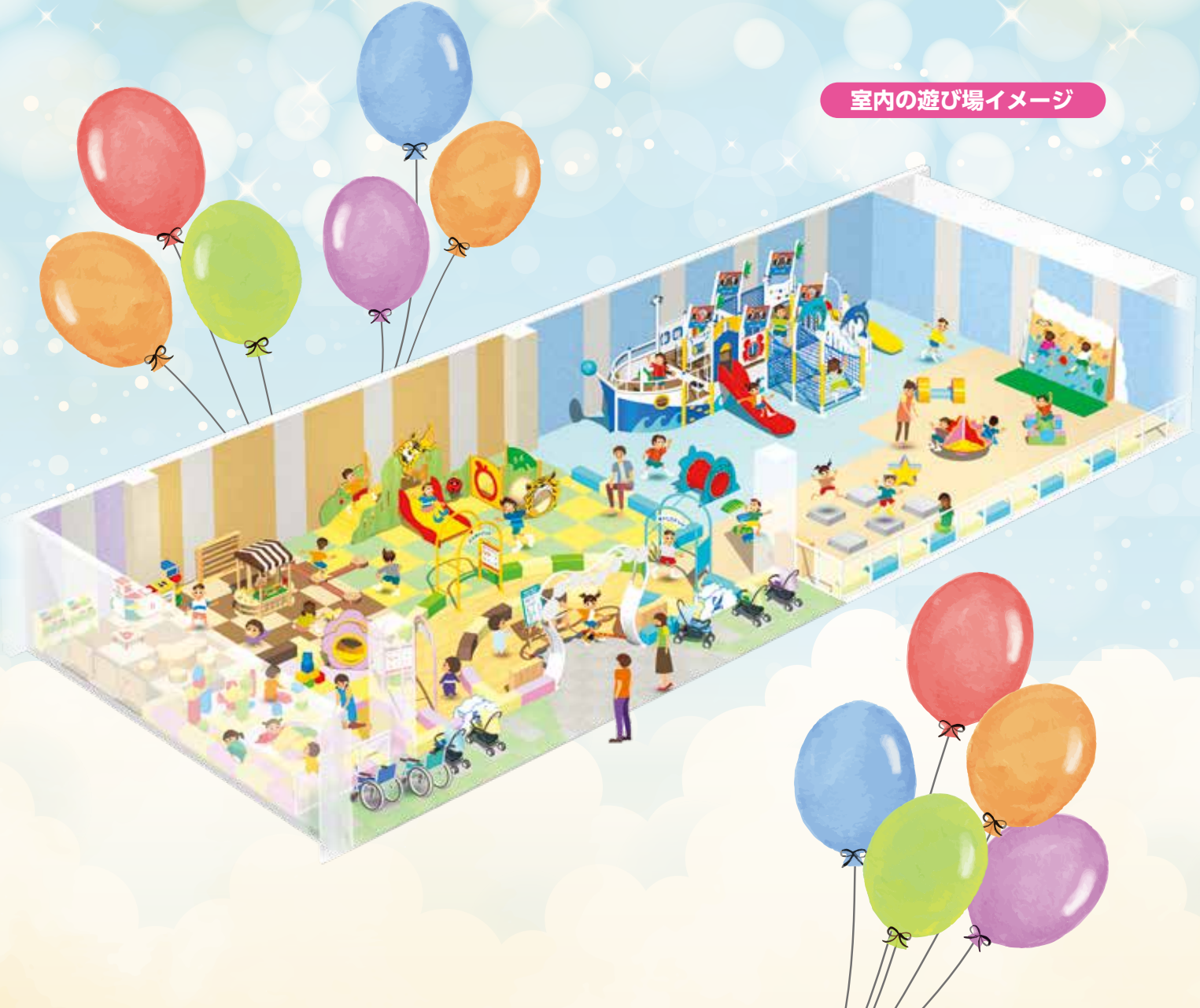
室内の遊び場イメージ