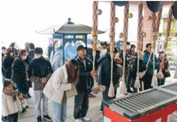
観音像の入り口で新年初のお参りをする人たち

新たな年を迎え各地の神社や寺に多くの初詣客が訪れ、新年の無事や多幸を祈願しました。釜石大観音では、おみくじを引いたり、縁起物の熊手や破魔矢、各種お守り、お札を買い求める人たちや記念写真を撮る人たちも多く、新しい年への期待感を高めました。両石港では、水平線から昇る初日の出を一目見ようと人々が集まり、穏やかな光に1年への思いを重ねていました。