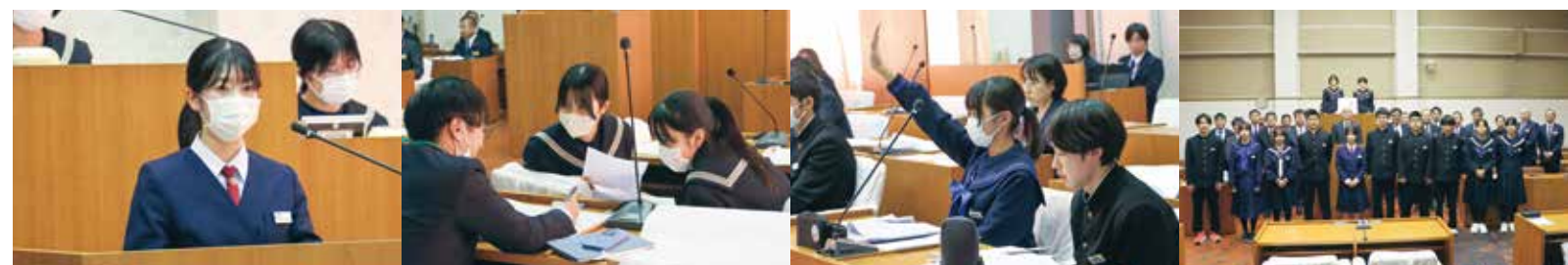
考えてきたことを一人ずつ質問