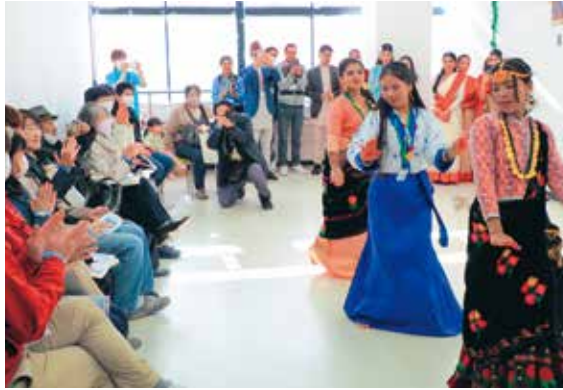
母国の民族衣装で伝統の踊りを披露する日本語学科の留学生

かまいしこども園の4～5歳児約30人が、毎年恒例のキャロリングでサンタクロースの衣装に身を包み「ジングルベル」「あわてんぼうのサンタクロース」「よろこびのうた」の3曲を披露しました。元気いっぱいの歌声とかわいらしい姿に、見ていた人たちは自然と笑顔になり心温まるひとときになりました。演奏後は、園児たちが描いた絵などが入ったプレゼントが送られました。