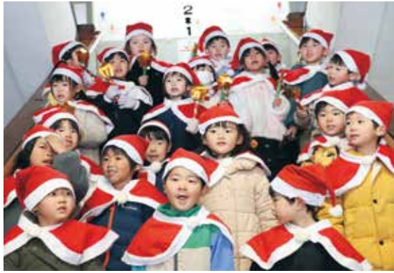
元気いっぱいに歌う園児たち