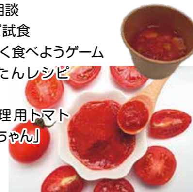
かまとまちゃんを使った減塩メニュー