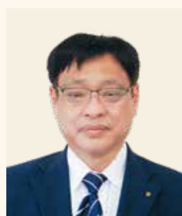
高橋 勝 教育長