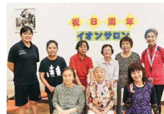
8周年記念プログラム参加者の記念写真

東日本大震災の被災地区を含む住民の心身の健康維持、コミュニティ形成、生きがいづくりや見守り支援などを行う「ご近所さえあひ復興事業(イオンサロン)」が8周年を迎え、記念プログラムが行われました。このサロンは、高齢者の閉じこもりやフレイル予防、新たな仲間づくりなどにつながっており、参加者は体力測定で日頃の運動の成果を発揮し、脳トレゲームなどに楽しく取り組みました。