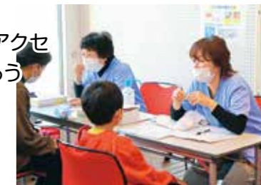
お口の健康づくり。真剣に学習中