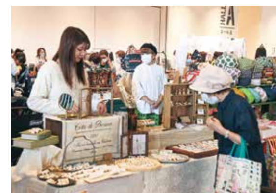
買い物を楽しむ来場者

市内外のすてきな人、店、もの、体験などに「であう」「つながる」きっかけにしておうと「きつとてと」が開催されました。会場には、音楽や食、ものづくり、ショッピングなど多様な楽しみを味わえる催しが用意され、大人から子どもまで幅広い年代が訪れました。参加者は地域の魅力を再発見しながら交流を深め「いろんな形の出合い」を感じる日となりました。