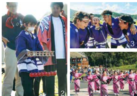
1 楽しそうに踊る子どもたち 2 けん玉に挑戦する参加者 3 掛け声で盛り上げのお囃子隊 4 先頭で踊るよいさ小町