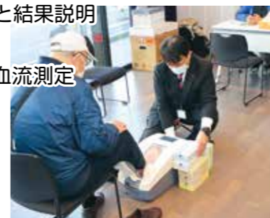
みんな気になる、骨密度測定