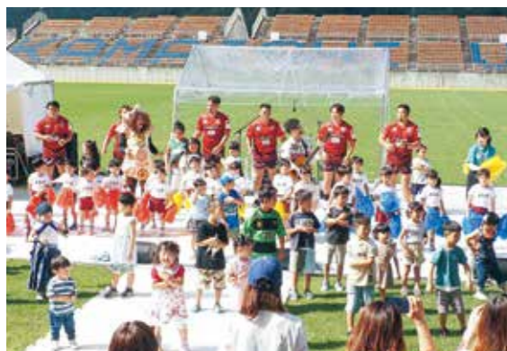
子どもや釜石SW選手も参加したアンダーパスのステージ