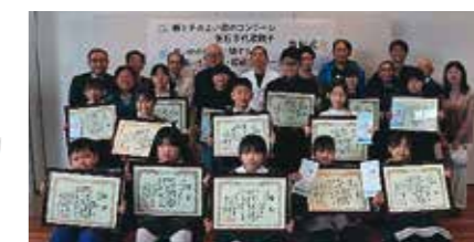
昨年度の表彰式の様子です