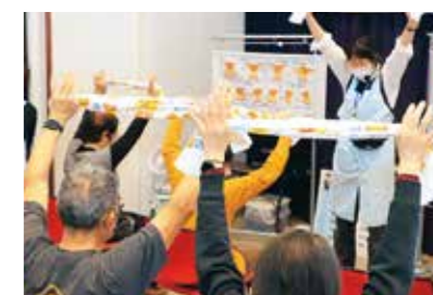
リフレッシュ!簡単タオル体操