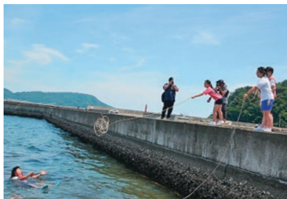
水難救助に取り組む生徒たち