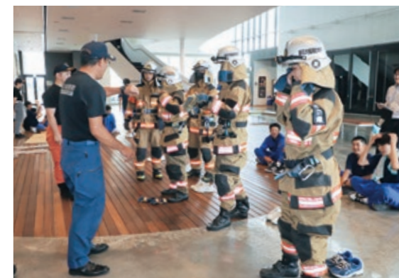
本物の消防服の重みに驚く生徒たち

中学生が多様な職業を体験する職業体験会が開催され、市内すべての中学2年生が参加しました。市内外の全12の職種の中から生徒自身が体験したいものを4つ選び、体験しました。体験や見学を通して、さまざまな職業に対する知識を深め、働くことの目的や意義を考えました。参加している生徒は終始笑顔で、難しいと言いつつも懸命に取り組む姿が印象的でした。