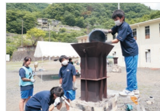
苦戦しながらも鉄づくりに取り組む生徒たち

7月2日、3日の2日間、釜石東中1年生が鉄づくり体験を行いました。この体験は、令和4年から市内すべての中学1年生が体験しており、鉄のまち釜石の歴史やものづくりの面白さ、大変さを学ぶ機会となっています。生徒たちは図面だけを頼りに灼づくり、製鉄に取り組み、地域のものづくりに触れました。市内他4校も8～9月に体験する予定です。