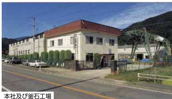
本社及び釜石工場