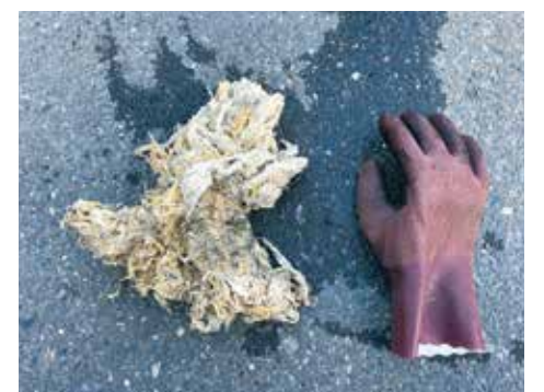
ポンプから取り出したタオル

⇒野菜クズや残飯、天ぷら油などは排水管を詰まらせたり、下水処理場の処理機能を低下させる原因になります。