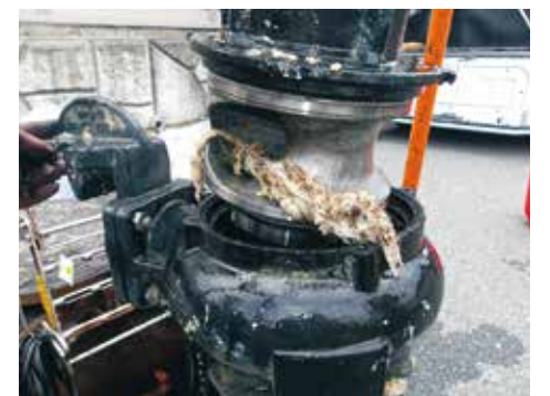
ポンプに詰まった異物

ポンプが異物を吸い込み、内部で絡まって動作なくなるとマンホールから汚水があふれたり、家庭の排水設備（トイレや台所など）から汚水が逆流してしまう恐れがあります。