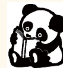
釜石市立図書館 マスコットキャラクター 「ホンホン」