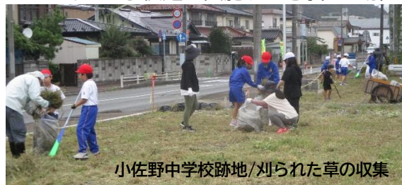
小佐野中学校跡地/刈られた草の収集

9月25日、絆会議(釜石中学校区の小中学生)による地区内公園等を対象とした 清掃活動が実施されました。始まって早々に雨が降り出し、思うような作業はできなかったかもしれませんが、でも子供達は実施する意義を理解し、割り当てられた現場では一生懸命取り組んでいました。