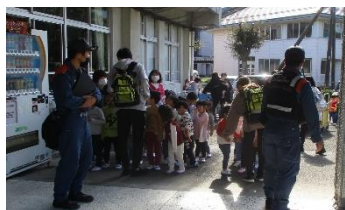
10/21 小佐野保育園 (火災発生を想定した訓練)