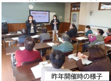
昨年開催時の様子

認知症について正しく学び、認知症の方やご家族を支えることができる地域を目指しましょう！皆さまの参加をお待ちしております。また、各地域に出向いての認知症サポーター養成講座にも対応させていただきますので、ご相談ください！