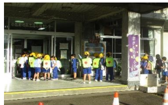
10/10 小佐野学童クラブ (大雨洪水を想定した訓練)

近隣の公共施設では、避難訓練がよく行われています。実際にはどんな災害かによって避難場所も変わり、引率者の的確な判断が必要となりますが、訓練においては、避難場所として公民館が使われることもあります。※公民館3階は、洪水、崖崩れ、内水氾濫等の場合、実際の避難場所に指定されています