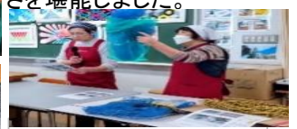
揚げサバの甘酢あん♡