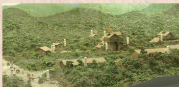
重さ約2tの炉底塊 橋野高炉（模型 1/100）