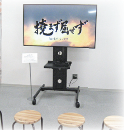
大型モニタによる 復興のあゆみの紹介