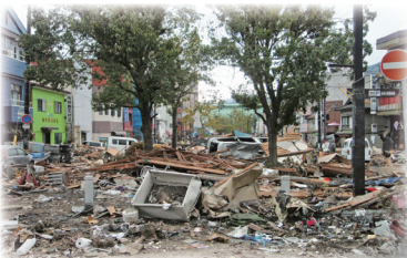
東日本大震災直後の 釜石市大町付近 (2011年)

釜石を含む三陸地方は、これまで幾度となく津波に襲われましたが、その都度復興を遂げてきました。このコーナーでは、東日本大震災を始めとする過去の津波の教訓を貴重な資料で後世に伝えます。