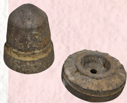
艦砲射撃で撃ち込まれた16インチ砲弾 艦砲射撃により被災した市街地

かつて釜石は、東北で唯一、製鉄所を持つ軍需都市でした。第二次世界大戦末期には、本州で初めて二度にわたる艦砲射撃を受けています。