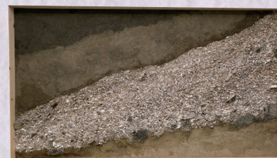
屋形遺跡から発掘された貝塚の一部