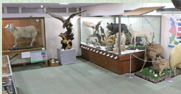
国の天然記念物 オオワシ