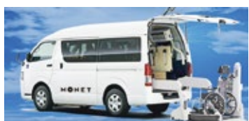
モバイルクリニック車両