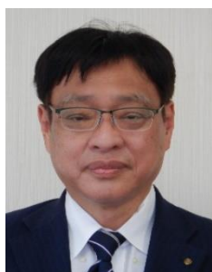
高橋 勝 教育長