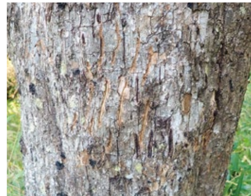
クマが登った木にくっきりと残った爪痕