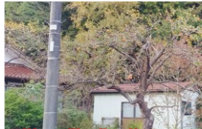
果樹やお供え物を放置しない

生ごみは、袋をしっかりと閉め、収集日の朝に出すなど、適正に廃棄処理するようにしましょう。