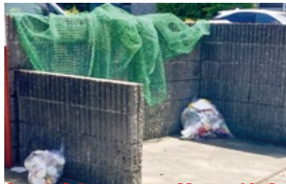
匂いが強いものの管理に注意

自宅や自宅周辺が、こんな状態になっていませんか？ 次の対策をして、クマの被害に遭わないようにしましょう。