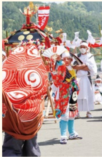
行列には町内7地区から約600人が参加し、神楽や虎舞、手踊りなどの郷土芸能で祭りは活気を帯びました。