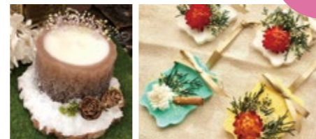
〈アロマキャンドル〉〈アロマサシェ〉好きな方を選んで作成していただけます。※写真は参考例です

市が整備するラベンダー観光農園と姉妹都市との友好の証に市内に植えているラベンダーを知っていただく機会として、ラベンダーアロマキャンドルなどのワークショップを開催します。一緒に作ってみませんか。事前の申し込みも受け付けます。詳しくは市のホームページをご確認ください。