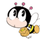
デザイン：石ノ森章太郎 生涯学習のマスコット「マナビイ」