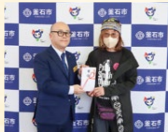
防災関連への活用のために寄付をいただきました。