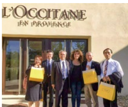
2018年9月に訪問したロクシタン本社工場