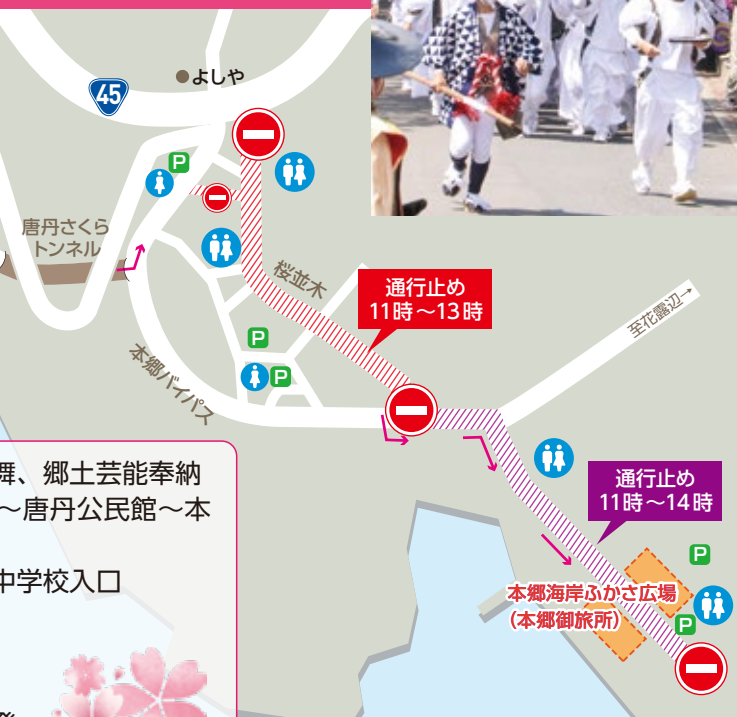
唐丹町本郷付近の略図

※行列操出に伴い、天照御祖神社～唐丹漁協の区間も9時30分～11時30分まで通行止めとなりますので、ご注意ください