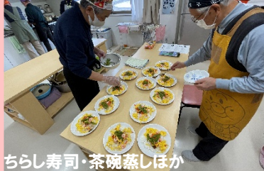
ちらし寿司・茶碗蒸しほか