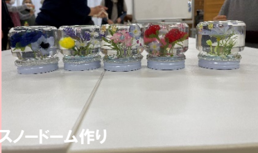
スノードーム作り