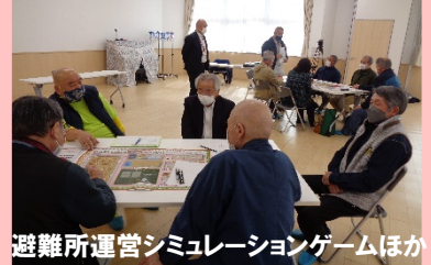
避難所運営シミュレーションゲームほか

令和4年度鶴住居公民館で実施した事業から抜粋して掲載しました。公民館事業には、基本的にどなたでも参加が可能です。まずは見学だけでもという方も大歓迎です。いっしょに学び、たのしみましょう！ 本年度も公民館だよりなどで事業のご案内をいたします。職員一同みなさまのご参加をお待ちしています！