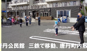
唐丹公民館 三鉄で移動、唐丹町内散歩