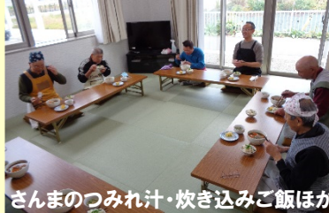
さんまのつみれ汁・炊き込みご飯ほか