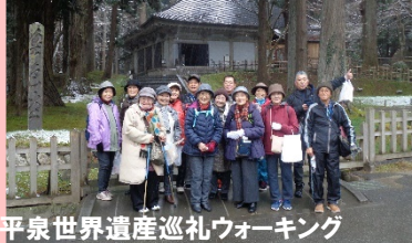
平泉世界遺産巡礼ウォーキング