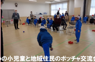
うの小児童と地域住民のポツチャ交流会