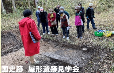
国史跡 屋形遺跡見学会