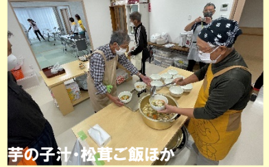
芋の子汁・松茸ご飯ほか