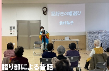
語り部による昔話