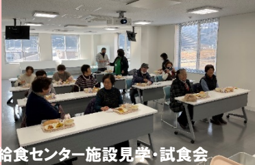
給食センター施設見学・試食会