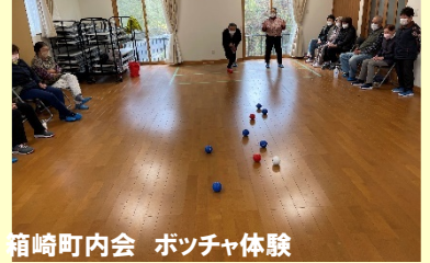
箱崎町内会 ポツチャ体験