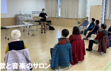
歌と音楽のサロン