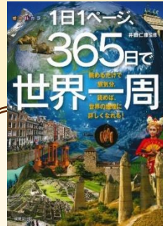
「1日1ページ、 365日で世界一周」 井田 仁康 / 監修 成美堂出版 (290.4 / 円)