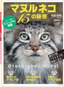
「マルネコ15の秘密 最古の猫、マルネコの秘密に迫る！」 イラスト解説ビジュアル図鑑」 南橋 俊輔 / 編著 今泉 忠明 / 監修 ライブ・パブリッシング (489.53 / 円)