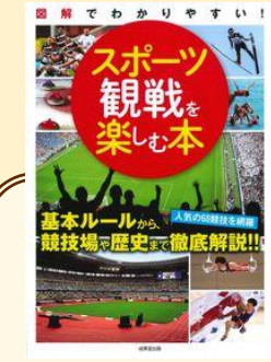
「スポーツ観戦を楽しむ本 図解でわかりやすい！」 成美堂出版編集部 / 編 成美堂出版 (780 / 円)