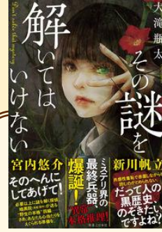
「その謎を解いてはいけない」 大滝 瓶太 / 著 実業之日本社 (913.6 / 円)