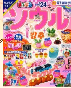
「ソウル'24 (まっぷるマガジン)」 昭文社 (292.14 / 円 / 24)