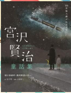
「宮沢賢治童話集 猫の事務所・銀河鉄道の夜など」 宮沢 賢治 / 著 日下 明 / 絵 小笠 裕二 / 監修 世界文化社 (498.41 / 円)