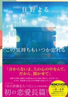
「この気持ちもいつか忘れる」 住野 よる / 著 新潮社 (YA 913.6 / 円)