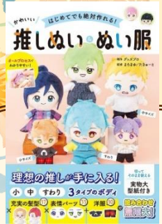
「はじめてでも絶対作れる！ かわいい推しぬい&ぬい服」 グッズブック / 制作 まちまゆ / 監修 たきゅーと / 監修 西東社 (594.9 / 円)