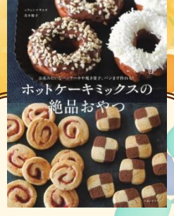
「ホットケーキミックスの絶品おやつ お店みたいなパンケーキや 焼き菓子、パンまで作れる！」 ムラヨシ マサユキ / 著 黒木 優子 / 著 主婦と生活社 (596.65 / 円)