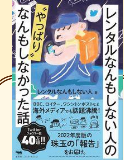
「レンタルなんもしない人の “やっぱり”なんもしなかった話」 レンタルなんもしない人 / 著 晶文社 (916 / 円)