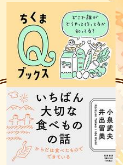
「いちばん大切な食べもの話 どこで誰がどうやって作ってるか知ってる？」 小泉 武夫 / 著 井出 留美 / 著 筑摩書房 (YA 610 / 円)