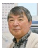
釜石医師会 県立大槌病院

認知症にならないために 高齢化が進む現代社会において、認知症は非常にありふれた病気となってきました。認知症を予防する事はまだまだ難しく、発症を遅れさせ、発症しても希望をもって日常生活を過ごせる社会を作っていくことが大事になります。 予防可能な12の危険因子が報告されています。①身体活動が少ない、②喫煙、③栄養のバランスの悪い食事、④飲酒、⑤認知トレーニング不足、⑥社会的孤立、⑦体重管理(中年期では肥満、高齢者では痩せがリスク)、⑧高血圧、⑨糖尿病、⑩脂質異常症、⑪うつ病、⑫難聴。その他、睡眠不足、歯周病、外傷性脳障害、大気汚染も関連が指摘されています。 そこで、対策として、①身体活動を増やし、有酸素運動やレジスタンス運動を行う②バランスのとれた食事をする(野菜、魚、全粒穀物を多く摂り、減塩すると共に赤身肉、加工肉、菓子類などを少なくし、適正なエネルギーと十分なタンパク質・ビタミンがとれる食事をする。いきなりご飯を食べるのではなく、野菜から食べるなど食べる順番に気を付ける)③中高年の肥満は減量する④糖尿病の薬物療法を継続する⑤高血糖や低血糖を防ぐ⑥血圧、脂質などの数値を良くする⑦ストレスにうまく対処し、適度な睡眠を取って心の健康を保つ⑧地域の行事など社会参加を行う⑨知的活動(読書、囲碁将棋、楽器演奏など)を行う⑩禁煙する事で、認知症の発症を遅らせることが期待されます。