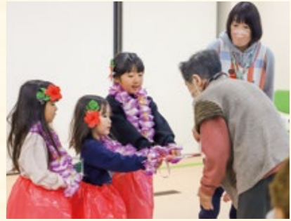
5歳児はハワイアンダンスを披露。クリスマスカードと松ぼっくりツリーをプレゼントしました