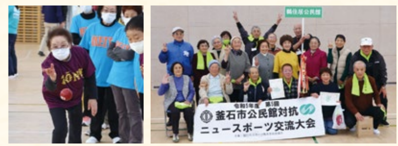
優勝した鶴住居公民館

地域の絆さらに深まる 市内8公民館対抗のニュースポーツ交流大会が行われ、総勢130人を超える参加者が室内グラウンド・ゴルフ、ボッチャ、スカットボール、輪投げの4種目の競技で汗を流しました。参加者はニュースポーツ競技を通じて、地域間交流を図りました。