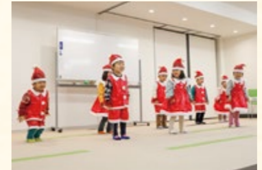
3歳児は小さいサンタさんになりきり、ダンスと歌を披露

感謝の思いを 歌声とダンスにさせて 上中島こども園の3歳児、5歳児の園児が、日頃見守ってくれている地域の皆さんへ感謝を伝えようと、ダンスや歌を披露しました。参加した地域の高齢者らは手拍子をしながら、子どもたちのお遊戯から元気をもらったような笑顔いっぱいの面持ちで見守りました。