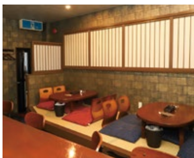
珍しく座敷があるスナック。その居心地の良さから「家みたい」と言うお客さんも少なくないとか

決めたらやるという「意志」と自分から調べて「動くこと」が大事だと思います。自分が動けば周りも動いてくれるので、まずは行動してみましよう！