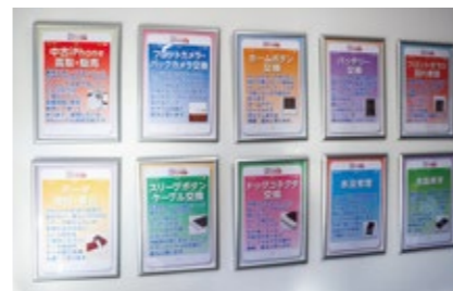
スマホからゲーム機器などの画面修理やバッテリー交換などに幅広く対応

起業したきっかけは？ 手に職をつけたいという思いで起業しようと考えました。昔から手先の器用さには自信があったことに加え、沿岸にはスマホなどの修理のお店が少なかったことや、起業にかかるコストが比較的安いことも決め手になりました。 起業する前にしたことは？ どのくらい競合がいるかを調べたり、練習用のスマホを手配して、修理の技術を習得したりしました。また、商工会議所に相談して補助金などを活用し、起業の準備を進めました。 起業して良かったことは？ 会社員時代はお客さんと直