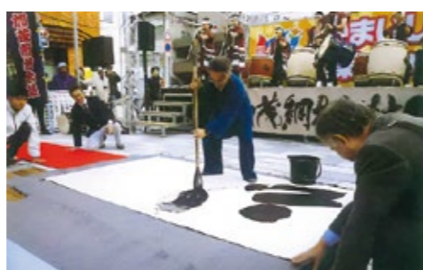
復興支援イベントでの書道パフォーマンス

日時 10月14日(土)～18日(水) 10時～17時 場所 市民ホールTETTO ギャラリー 内容 【一味違う現代書と刻字作品展示】 ・浮出文字、墨彩書、メタリック色彩書、色文字 ・木彫、石彫刻字 ・布書(帯、着物他) ・写真とのコラボ作品 【実演・体験コーナー】 期間中の13時～14時 ・大正琴と書道パフォーマンス(14日(土)のみ) ・学校では教わらない書の体験(中学生以下対象) ・いきいき脳トレの体験