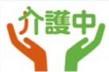
外出先で「介護マーク」を見かけたら、温かく見守ってください

問い合わせ 市地域福祉課 障がい福祉係 ☎22-0177 FAX 22-6375