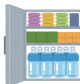
食料・水などの 備蓄

災害時にすぐに避難を開始できるように、非常持出袋を用意しておきましょう。この機会に中身の確認を行い、必要に応じて飲料水や非常食などを新しいものと交換しておきましょう。