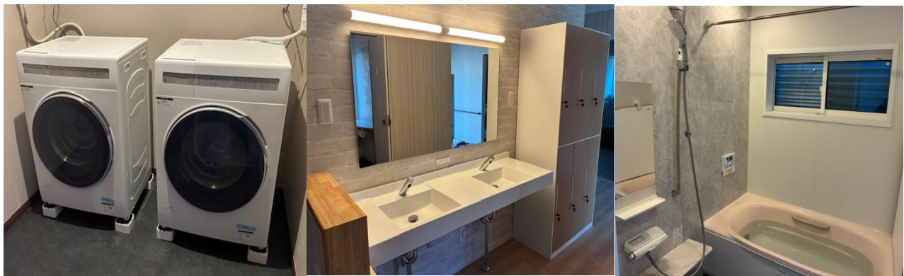
ドラム式洗濯乾燥機 (各階2台) 洗面台・鍵付き個人用ロッカー 1.25 坪の浴室