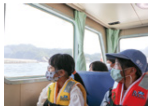
釜石湾内クルーズ体験会

残念ながら、9月の「昆虫観察会」は中止、12月の「冬の星空観察会」は2月に延期となりましたが、今後も多くの子どもたちが自然環境に興味を持つきっかけになるよう、継続して活動していきます。