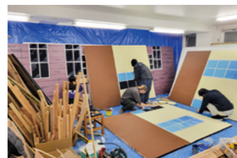
真剣な稽古の成果を、ぜひ舞台でご覧ください

長い戦争の終戦間近の昭和20(1945)年、二度にわたる艦砲射撃を被った釜石の厳しい環境で、子どもや若い女性が力強く生き抜いた姿を描きます。