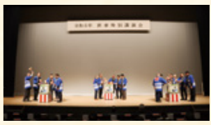
新型コロナウイルスの収束を願う鏡開き