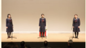
釜石高校音楽部によるオープニングアトラクション

会では、講演の他、同社の賞品が当たる抽選会や地元経営者らとの名刺交換会なども行われ、一年の始まりに弾みをつけました。