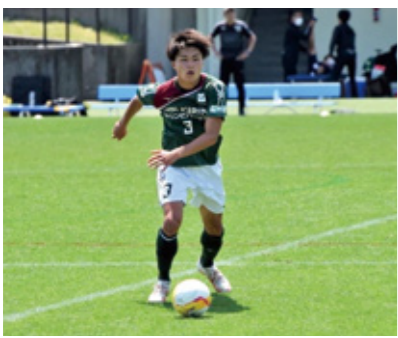
球際で体を張り、気迫を前面に出すプレーが持ち味 (上：高校時代 下：現在)

までは、途中出場が多かったものの、秋のリーグ戦ではスタメンで出場することが多くなった。昨年12月に行われた全日本大学サッカー選手権の初戦もスタメンで出場。PK戦にもつれる、し烈な戦いを制した。その後チームは勢いに乗り、次戦にも勝利。準々決勝で関西王者の関西学院大学に1-0で敗れたものの、全国ベスト8進出に大きく貢献した。「来年からはチームの主軸としてチームを勝たせられるように頑張りたいです。常葉大学の知名度をもっと上げたいと思います」とその視線はすでに来シーズンを見据える。