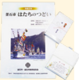
はたちのつどい 記念品