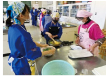
市食生活改善推進員などのスタッフが各班に入り、一人一人に調理指導をしました

釜石市の小学生から高校生までの朝食欠食率は岩手県と比べて高く、特に中学生・高校生へと年齢が上がるにつれて高くなる傾向にあります。朝食欠食は生活リズムの乱れ、心の健康への影響、学力や体力の低下などに繋がります。市は、朝食欠食率の低下を目指し、中学校の家庭科授業の一環として平成30年度からこの事業を実施しています。本年度は、釜石中1年生、甲子中1年生、釜石東中3年生を対象に実施しました。