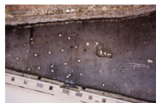
川原遺跡 建物礎石（鶏住居町）