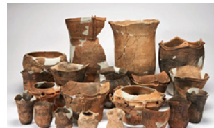
野川前遺跡出土土器（箱崎町）