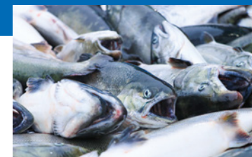
水揚げされた「釜石はまゆりサクラマス」

水産による教育・研究・他地域での取り組みの紹介や「釜石はまゆりサクラマス」の今後の展望などの講演を通して「魚のまち釜石」復活に向けた新たな取り組みの可能性を考えます。