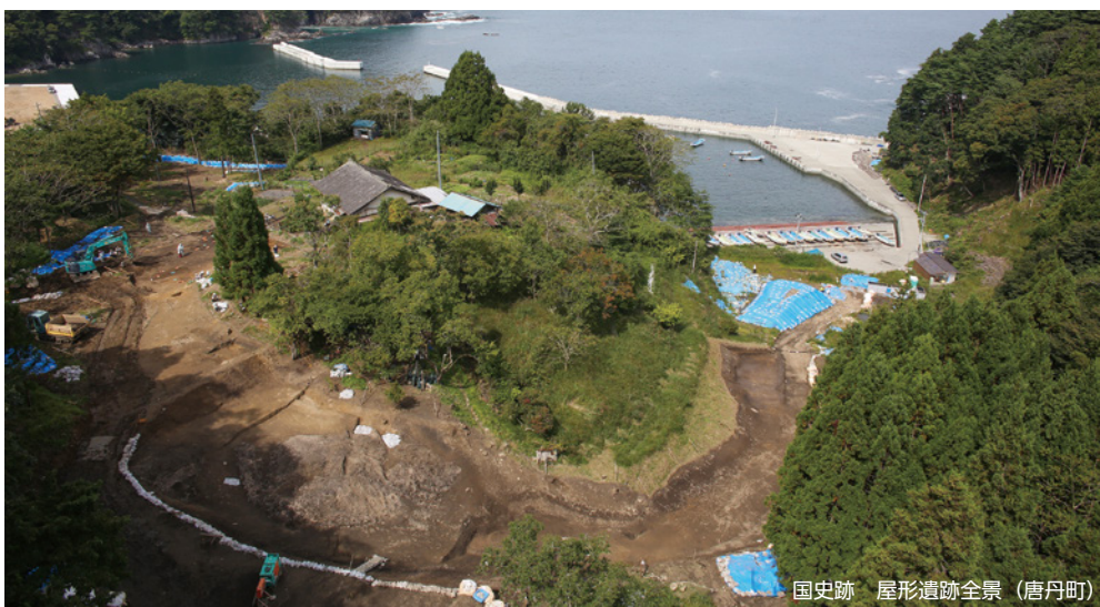
国史跡 屋形遺跡全景（唐丹町）