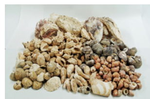
屋形遺跡 出土貝類（唐丹町）