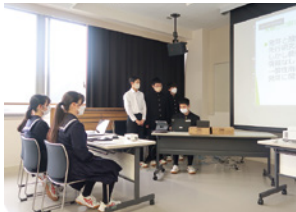
釜石高校生徒による 課題研究成果発表