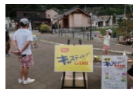
キャストイング体験

巡視船「きたかみ」一般公開 開催日 11月3日(木・祝) 10:00~12:00/13:30~15:30 【場所】釜石港須賀地区官庁船棧橋