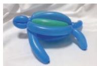
バルーン配り (先着でプレゼント)