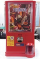
フィギュアガチャ