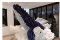
バルーンオブジェ (何が出来るかはお楽しみに!)