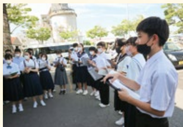
青森大空襲の被害を物語る石壁を見学する生徒ら（左）

互いのまちを訪れ、交流を深めた中学生は「戦争体験の生の声を聞き、戦争の恐ろしさや平和の大切さを改めて感じた」「災害もいつ起こるか分からない、日頃の準備が必要」と話し、理解を深めました。