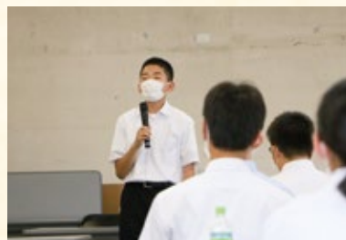
学んだことを基に実際の行動に移し、平和で安全な世界にすると誓いました（右）