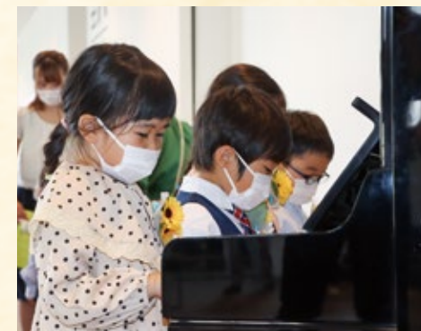
興味津々でピアノを演奏する園児ら