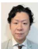
釜石薬剤師会 はまゆり調剤薬局

お薬手帳を活用しましょう！ 薬局で薬を調剤してもらう際、ほぼ必ず「お薬手帳はありますか？」と尋ねられるはずです。いつ・どこで・どんな薬が処方されたかを記録しておくものですが、患者さんにとってのメリットとは何でしょうか？それは、より安全で効果的な医療を受けやすくなる点にあります。 お薬手帳の大きな役割の1つ目はお薬の飲み合わせを確認できることです。複数の医療機関を受診して、それぞれから薬が処方された時、薬局では良くない飲み合わせがないか、同じような薬がないかをチェックしています。 2つ目は医療機関でお薬手帳を見せることで適切な治療を受けることができます。今飲んでいるお薬の内容はもうらん、過去に副作用の出たことのあるお薬やアレルギー歴、病歴などを書いておくと、医師や歯科医師の治療の参考となることです。 3つ目は緊急時に効果を発揮することです。東日本大震災の時にはお薬手帳を見せることでお薬を受け取ることができました。旅先で急に体調を崩したり怪我をした場合も、正確にお薬の情報を伝えることができます。 お薬手帳を常に持ち歩くのが大変でも、スマートフォンのアプリ上で管理できるものもあるので活用ください。