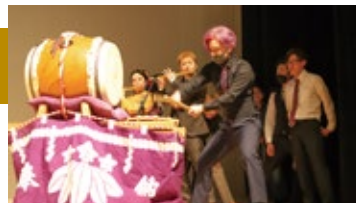
新成人による郷土芸能披露(令和4年)