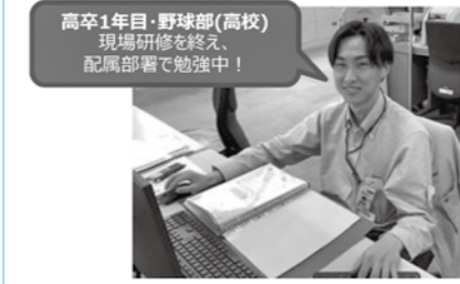
高卒1年目・野球部(高校) 現場研修を終え、 配属部署で勉強中!

SMCは世界83の国と地域、532の営業拠点、29の国と地域に生産工場を持つグローバルカンパニーです。空気圧による自動化の制御技術を通じて、あらゆる産業分野の高度なオートメーション化に貢献しています。空気圧制御機器業界では国内64%・世界39%の世界トップシェアを誇ります。一緒に「ものづくり」を岩手から世界へ発信しましょう!