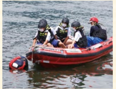
指さし確認と声かけで、落水者を見失わないよう近づきます

(一社)Atlantic Pacific Japanと(一社)根浜MINDが根浜海岸で水難救助の大切さを学ぶイベントを開催し、唐丹中の生徒が参加しました。英国式救命ボート「ウェールズ号」に乗り、落水者に見立てた人形を救助する訓練や、ロープを利用した落水者の引き上げを体験しました。生徒らは、海水浴シーズンを前に、安全意識を高めることができました。