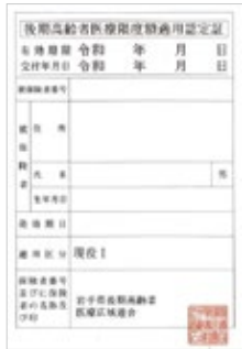
③ 限度額適用認定証