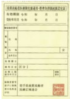
② 限度額適用・標準負担額認定証