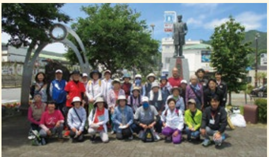
共に汗を流し、絆も深まりました

陸中大橋駅から釜石駅までを歩くイベントが甲子、小佐野、中妻の3公民館の合同で開催され、3地区の地域住民延べ83人が参加しました。この交流会では、5月12日を皮切りに、5月17日、24日、6月14日の4日間の行程で、20キロの道のりを歩きました。参加者のうち、15人が4日間全ての行程に参加し「完歩賞」を受賞しました。このウォーキング交流会は、コースを変更し来年も開催予定です。