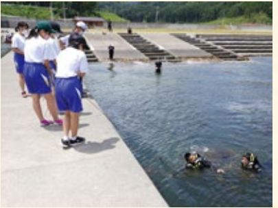
狙った場所にロープを投げ込むのは意外と難しいもの。絶妙な力加減が求められます

叙勲は、国家または公共に対し功労のある方、社会の各分野で優れた行いをした方などを国が表彰するものです。令和4年春の叙勲を受けた釜石ゆかりの方を紹介します。