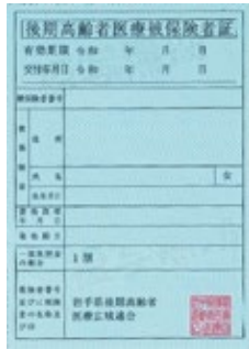
④ 保険証（青色） 有効期限 令和5年7月31日(月)

医療費受給者証（子ども医療、ひとり親医療、重度心身障がい者医療、身体障がい者3級医療費受給者証）