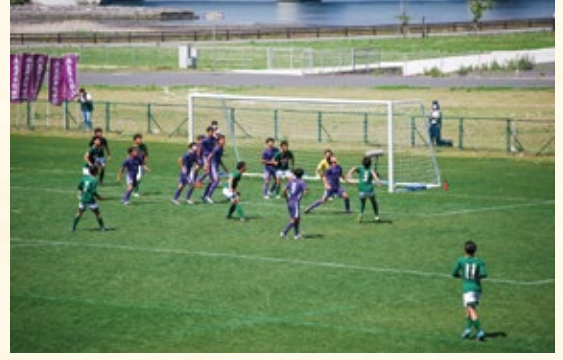
激しく球際で競り合う両チームの選手

東北高校サッカー大会の決勝戦が釜石鵜住居復興スタジアムで開催され、青森山田高校(青森第1代表)が花巻東高校(岩手第1代表)を2-1で下し、5年ぶり10回目の優勝を飾りました。スタジアムはサッカーでの利用も増え、より多くの人に利用されています。