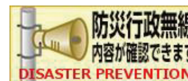
ホームページのバナー

市のホームページで防災行政無線の放送内容を確認できます。ホームページのトップ画面右下にあるバナーをクリックすると確認画面に移動します。または、右下のコードから確認画面に移動できます。