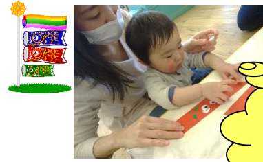
こいのぼり作ろう!