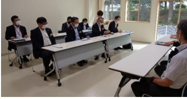
見学後、学校からの説明