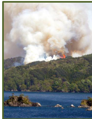
平成29年に釜石市で発生した山火事