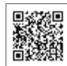
県のホームページ