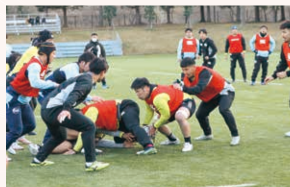
チーム内でも激しくコンタクト練習します

A 開幕からホームゲームの初戦までは少し期間が空くが、勝利を重ね市民の皆さんにいいニュースを届けます。ホームゲームには、ぜひ来場していただき、一緒に戦いましょう。