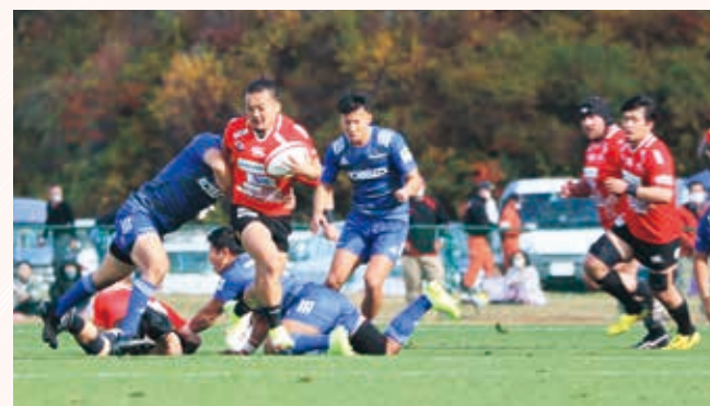
決して大きな体ではありませんが、チームの先頭に立ち体を張り続けます

A 釜石シーウェイブスの良さは、市民の皆さんとの距離の近さです。市民の皆さんに、応援してもらえるような、親しみをもちもらえるような強いチームを目指します。