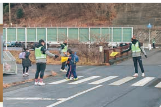
大きくて強い選手は、子どもたちの憧れの存在です。毎朝3～4人の選手らが横断歩道に立ち、小学生の登校を見守っています