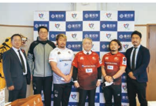
11月5日の釜石市役所への訪問を皮切りに、12月8日までに県内全ての市町村を訪問しました

A 地域の皆さんが笑顔や幸せな思いを持てるようなプレーを、スタジアムで見せます。満員の釜石鵜住居復興スタジアムで、選手と皆さんの気持ちが一っになるような試合を生で観戦してください。