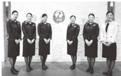
JALふるさと応援隊の皆さん