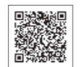
市のホームページ

スマホ決済アプリ「PayPay(請求書払い)」で納付できます。詳しくは、市のホームページをご覧ください。