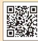
釜石医師会の ホームページ

A このシステムに加入している釜石・大槌地域の病院 (6カ所)、医科歯科診療所 (25カ所)、薬局 (16カ所) で発行しています。県立釜石病院に受診歴のある人が対象です。詳しくは、釜石医師会のホームページをご覧ください。