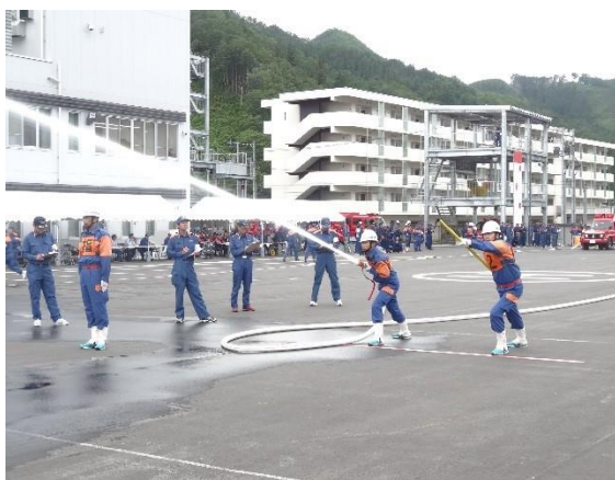
遠野釜石地区支部消防操法競技会