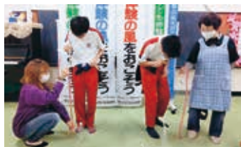
手洗い30秒チャレンジ

地域の皆さんから、子どもたちの活動を見守っていただく安全管理員(協働活動サポーター)を随時募集しています。詳細は、市まちづくり課までお気軽にご連絡ください。